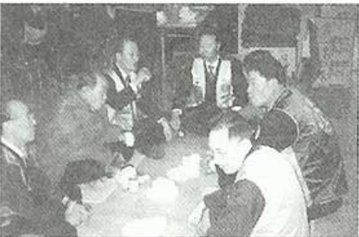
| 대림라이온스 방문 |

대한불교청소년교회연합회에서 청소년 60명이 단체봉사를 나오셨습니다. 얼굴맞사지, 발맞사지, 구두닦기, 목욕 등 하루일과를 어른들과 함께하며 즐거움을 나눠 주고 있습니다. 청소년들이 봉사하면서 느낀 것들이 앞으로의 삶에 큰 느낌으로 다가갔으면 좋겠습니다.