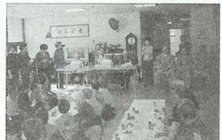
| 백련사 잔치(12.16) |

제1회 운동회가 있었습니다. 양로원의 모든 어르신과 sk c&c 직원들이 봉사를 해주신 덕분에 처음으로 운동회를 했습니다. 어르신들 모두 어찌나 열심히 잘하는지... 우리 모두 놀라워했습니다. 마음은 모두 청춘이라는 것을 새삼 느끼게 되었습니다.