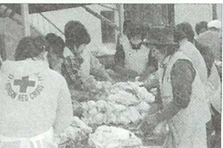
| 김장(11.30) |

매년 백련사에서는 12월에 맛있는 음식을 장만하여 잔치를 열어주시고 계십니다. 음식을 드시며 가수의 흥겨운 노래소리를 듣는 시간은 이제 어르신들이 기다리는 날입니다. 백련사 운경스님과 신도님들에게 진심으로 감사드립니다.