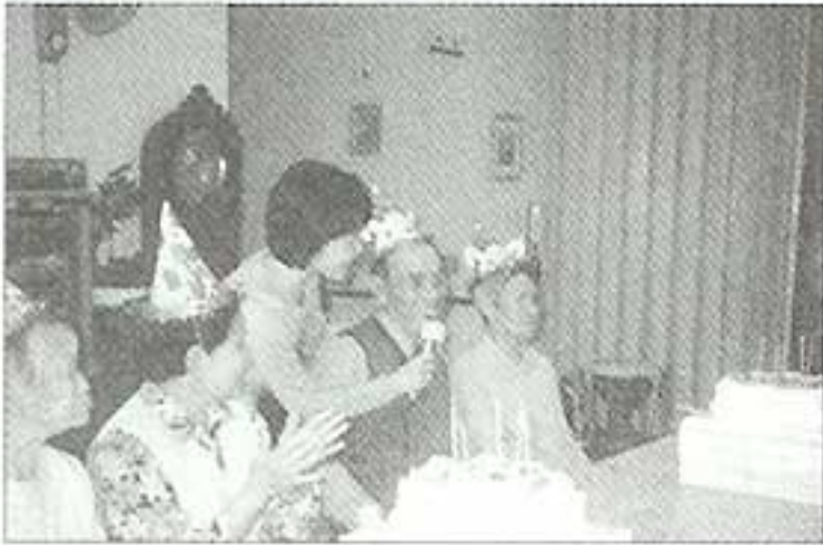
| 생일잔치 |

매달 어르신들 생신잔치가 있습니다. 푸짐한 음식은 없어도, 근사한 분위기는 아니라도 늘 즐겁고 기다려지는 생신잔치입니다. 이번엔 최고령의 남녀 어르신들이 생신을 맞으셨습니다. 어르신들 만수무강하세요.