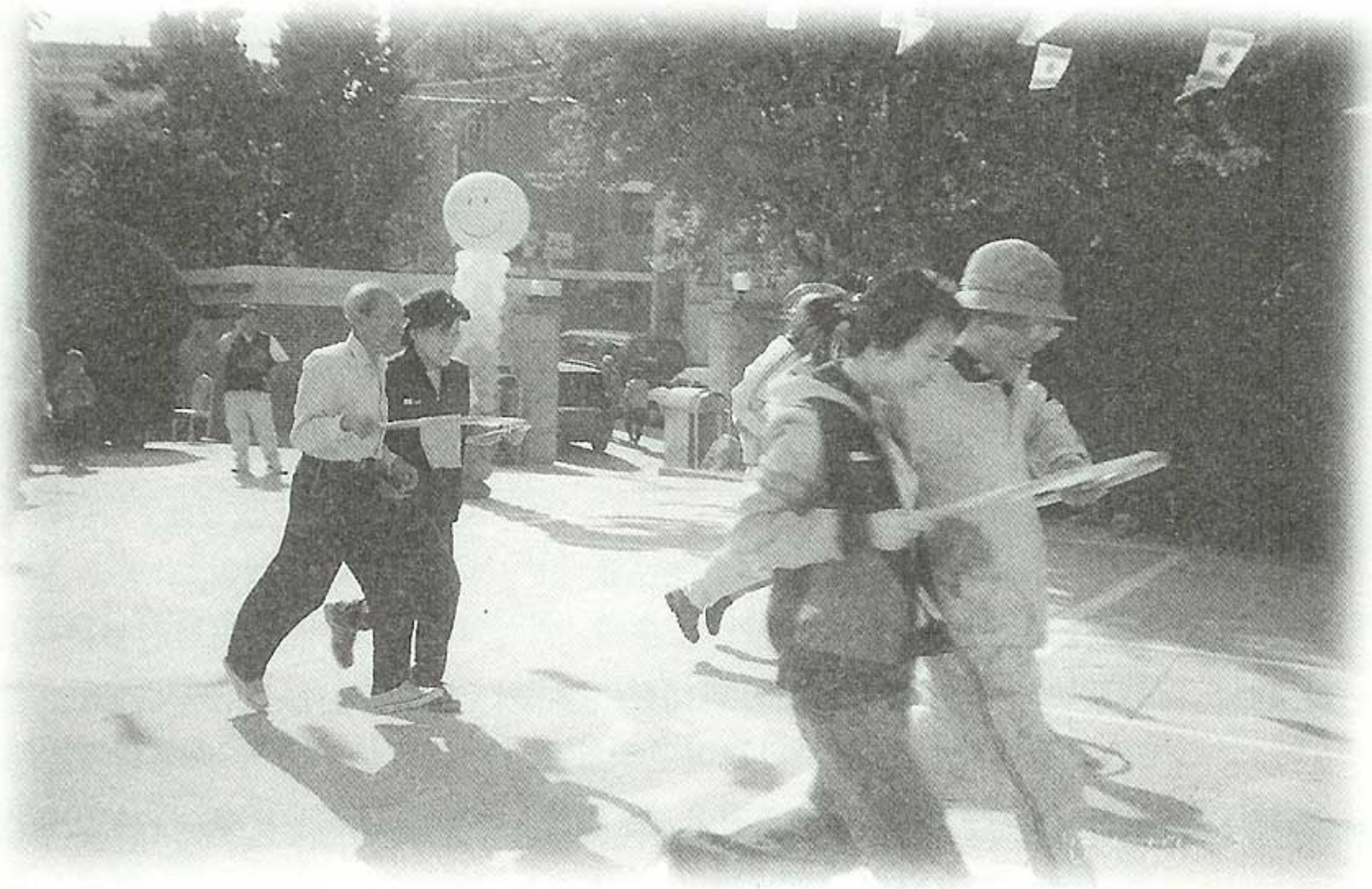
제1회 마음은 청춘! 즐거운 운동회