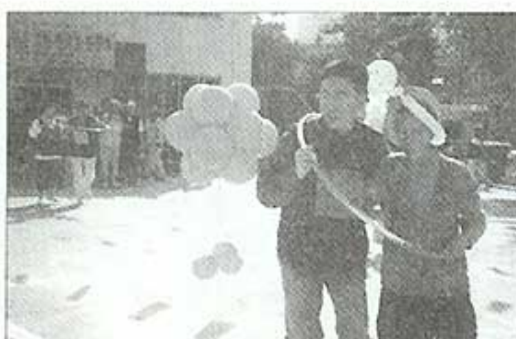
| 마음은 처음 즐거운 운동회 |

대림라이온스에서 방문하여 어르신들에게 따뜻한 겨울 조끼와 맛있는 간식을 정성스럽게 대접하고 갔습니다. 어른들이 조끼를 어찌나 좋아하시는지... 다시 한번 감사드립니다. 대림라이온스 회원 여러분 복된 새해맞기 바랍니다.