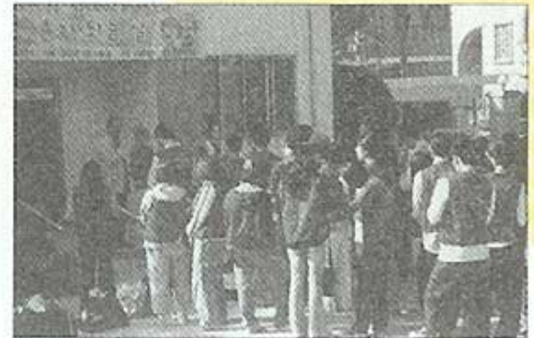
| 청소년교회관심서약반단체봉사 |

어르신들과 직원 50여 명이 가을 나들이를 다녀왔습니다. 덕산온천에서 온천욕을 하시고 맛있는 산채 비빔밥을 드신 후 유서 깊은 수덕사에서 불공을 드리는 것을 끝으로 즐거운 나들이를 마쳤습니다.