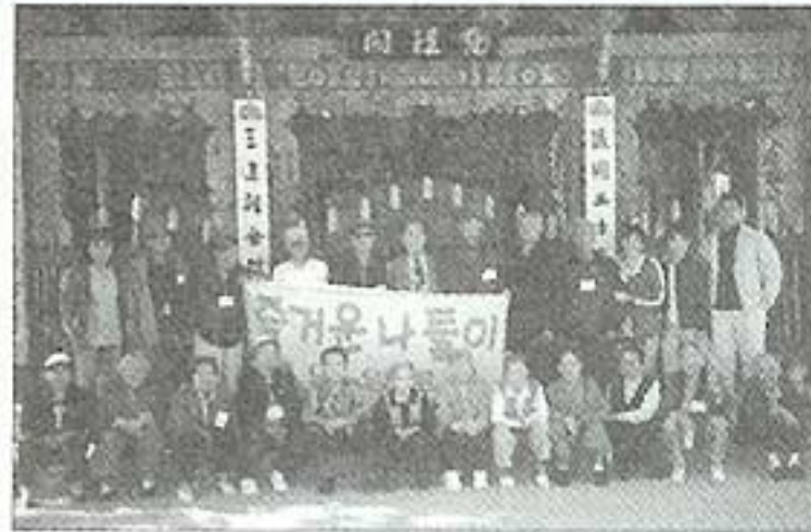
| 수덕사, 덕산온천나들이(10.22) |

매달 어르신들 생신잔치가 있습니다. 푸짐한 음식은 없어도, 근사한 분위기는 아니라도 늘 즐겁고 기다려지는 생신잔치입니다. 이번엔 최고령의 남녀 어르신들이 생신을 맞으셨습니다. 어르신들 만수무강하세요.