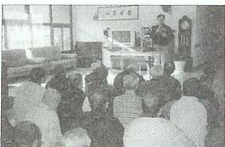
| 소방교육(11.5) |

월동준비로 양로원에서는 김장 1,400포기를 했습니다. 대한적십자회원분들과 안양213부대 장병들의 도움을 받아 이틀에 걸쳐 진행되었습니다. 맛있는 김치를 먹을 때마다 수고하신 분들을 늘 떠올리며 감사드립니다.