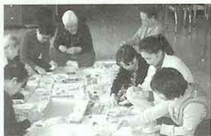
| 만두만들기 |