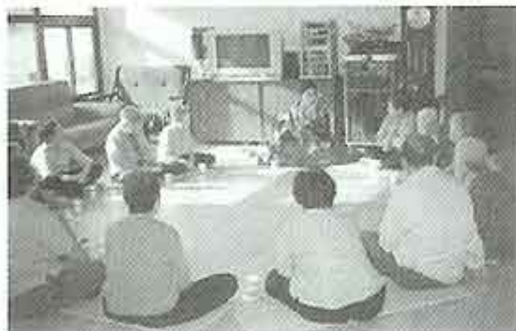
| 이야기 시간 |

전국학부모연합회에서 양로원을 방문하여 생필품과 어른들 한 분당 5,000원씩 용돈을 나눠주셨습니다.