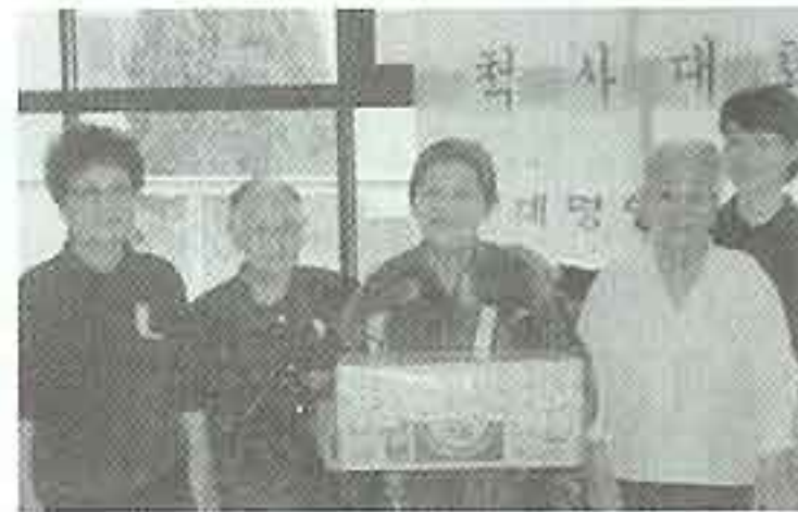
| 척사대회 |

이해찬 국무총리께서 해명복지원을 방문하여 사업시찰과 격려를 해주셨습니다.