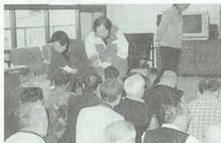
| 전국학부모연합회 |

설을 맞아 양로원 어른신들이 만두를 만드셨습니다. 얇전하게 앉아 만두를 빚는 모습은 영낙없는 새색시입니다. 예전에 만두 만들어 드시던 시절 이야기로 꽃을 피우며 즐겁게 만든 만두는 맛도 기가 막혔습니다.