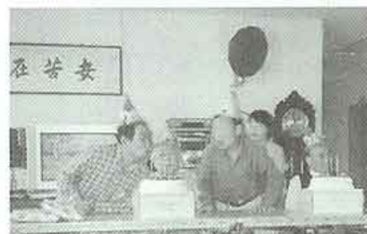
| 생신잔치 |

라이언스 안과에서 직원들이 십시일반 모은 후원금 529,500원을 전달하였습니다. 전달된 후원금은 어른들이 생활하시는 데 유용하게 쓰여졌습니다.