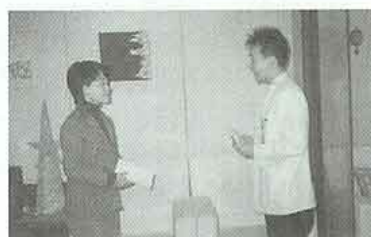
| 라이언스안과 후원금 전달 |

대보름을 맞아 윷놀이대회가 있었습니다. 작년에 할머니가 우승을 했으나 이번에 할아버지가 우승을 가져가 나란히 1:1의 결과를 빚었습니다. 서로 양보하며 이번엔 할아버지가 이겨야 한다고 말씀을 하시는 모습을 보며 어른들의 넉넉한 마음을 볼 수 있었습니다. 즐거운 대보름 같이 올 한해 모두 즐거운 시간들이었습니다.