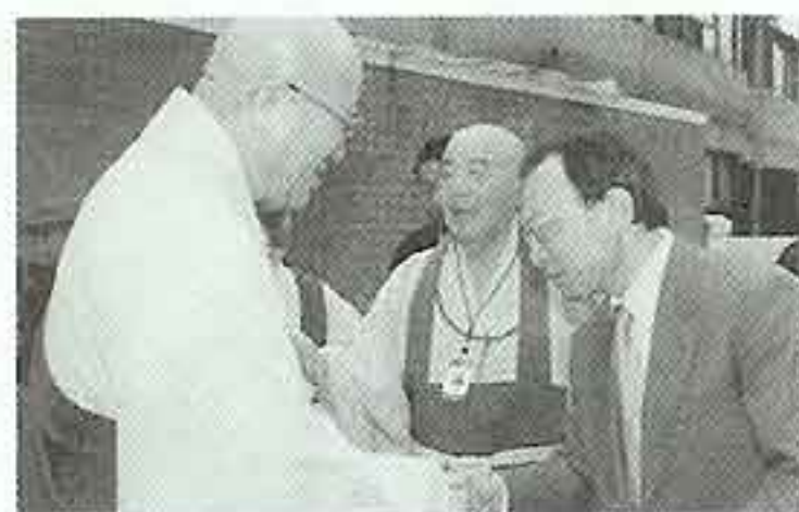
| 05.2.7 이해찬 국무총리 해명복지원 방문 |

어른들이 째째이 하시는 민화투. 늘 삼삼오오 앉아 진지한 얼굴로 화투를 바라보는 어른들을 보면 그 어떤 일을 할 때보다도 진지해 보인다. 어른들이 좋아하는 민화투로 대회를 한번 열어야겠다. 는 생각을 해봅니다.