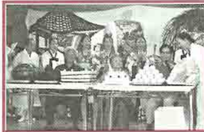
| 생일잔치 |

의료보험공단에서 주최하여 삼개월간 뱃돌체조가 있었습니다. 일주일에 3일 진행 된 체조는 어른들과에 쉽게 재미있게 이루어져 즐거운 시간이었습니다.