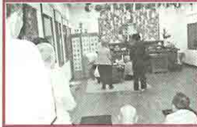
| 추석차례 |

10월4일 추석을 맞아 어른들에게 추석빔을 구입하여 드렸습니다. 예쁜 추석빔을 입으시고 따뜻한 겨울 보내세요.