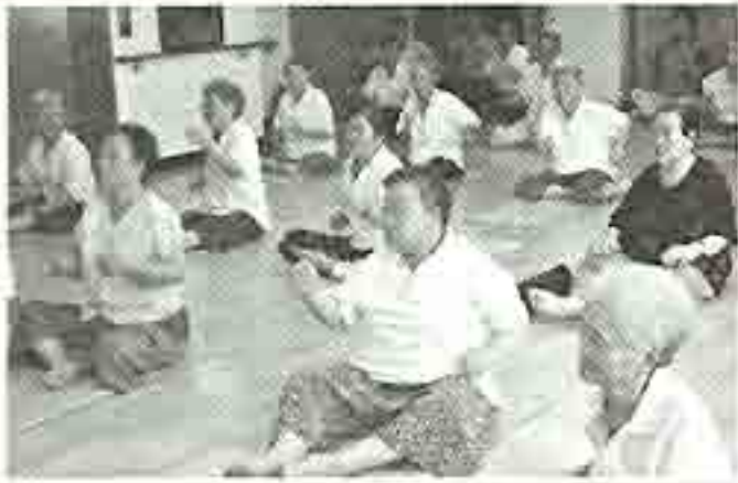
| 뱃돌체조 |

의료보험공단에서 주최하여 삼개월간 뱃돌체조가 있었습니다. 일주일에 3일 진행 된 체조는 어른들과에 쉽게 재미있게 이루어져 즐거운 시간이었습니다.