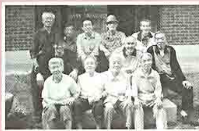
| 충천박물관 관람 |

8월27일 국립국악악단에서 어른들에게 흥겨운 국악공연을 해주셨습니다. 한복을 곱게 차려입고 다양한 우리악기를 연주하는 공연팀의 모습이 참 아름다워 보였습니다. 사회자의 구수한 입담과 함께 이루어진 공연시간은 짧게만 느껴졌습니다. 다음에 또 오세요