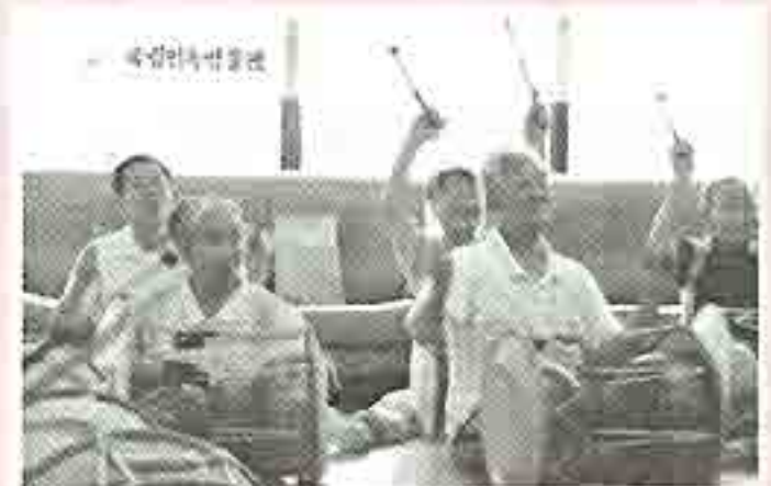
| 우리악기배우기 |

7월 생신잔치는 춤소리한마당에서 오셔서 생일잔치를 해주셨습니다. 상차림에서 공연까지 풍성한 생신잔치마당을 마련해주셔서 흥겨운 시간이었습니다. 춤소리한마당 공연팀에 감사드립니다.