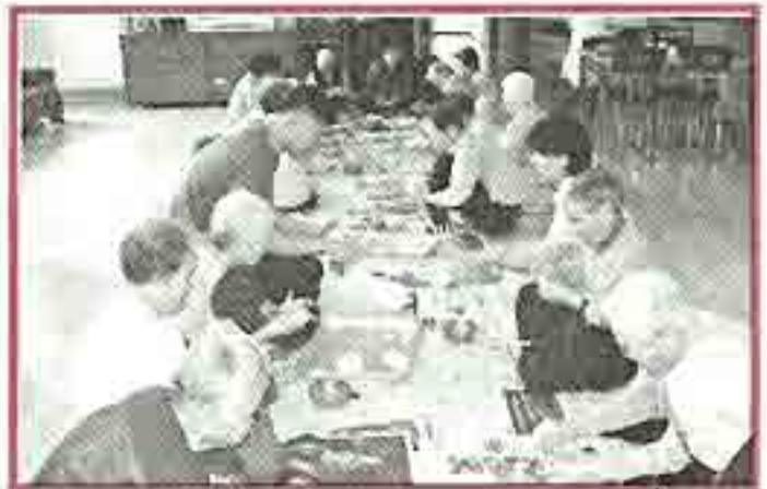
| 송편빚기 |

9월22일 광명에 있는 이익현선생 박물관에 양로원어른 12명이 관람을 다녀왔습니다. 호젓하게 차려놓은 박물관에서 옛것들을 다시 한번 보며 답소도 나누고 산책도 하며 즐거운 시간을 가졌습니다. 주변에 이런 곳이 많아 자주 다녔으면 좋겠습니다.