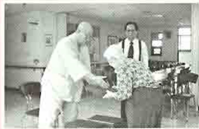
| 추석빔구입 |

10월4일 추석을 맞아 양로원어른들이 송편을 빚었습니다. 둘러 앉아 두런두런 얘기도 나누며 이야기 꽃을 피우며 만든 송편은 할아버지께서 산에서 따온 솔잎으로 찌서 맛있게 간식으로 나눠 드셨습니다. 늘 한가위 같았으면 좋겠습니다.