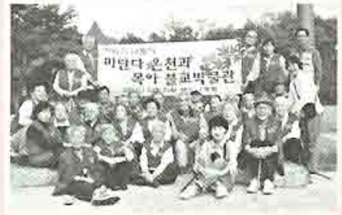
| 가을나들이 |

10월6일 추석날 아침 6시 양로원의 어른들도 정성스럽게 상을 차려놓고 법당에서 차례를 지냈습니다.