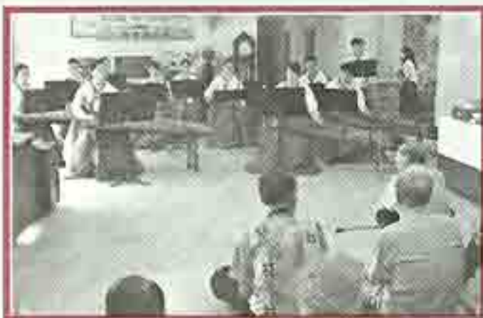
| 국립국악관현악단 공연 |

7월25일민속박물관에서 방문프로그램을 해주셨습니다. 오전엔 우리악기배우기와 오후엔 소고만들기로 이루어진 일정은 양로원이 하루 종일 색다른 즐거움으로 넘쳤습니다. 십진 않을 텐데 노인시설을 찾아가 프로그램을 진행해주시는 박물관에 감사드립니다.