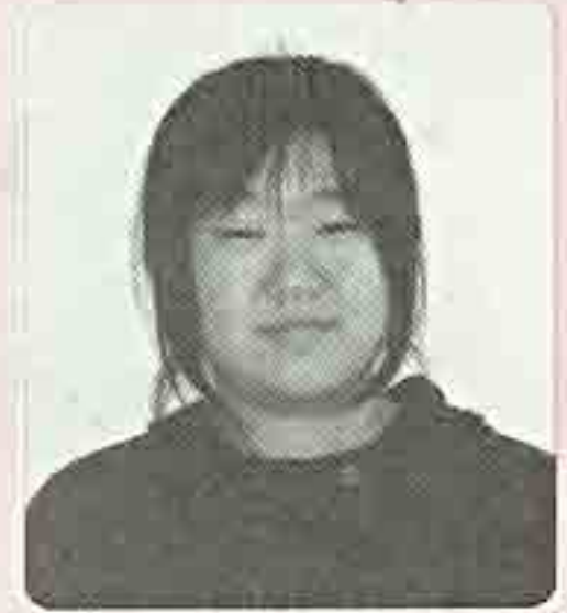
금강정사 학생회 마애불 송 예 술

어느 덧 혜명양로원으로 봉사를 다닌지도 2년 가까이 되었다. 봉사를 다니면서 제일 먼저 느낀 것은 마음만 앞서서는 이도저도 안되고 처음의 마음을 유지하며 꾸준히 봉사를 하는 것이 가장 중요하다는 것이었다. 처음에 스님께서 절에 다니는 거니까 한 달에 한 번 정도 봉사를 다니는 게 좋을 것 같다고 말씀하신 것이 우리와 혜명양로원의 인연의 시작이었다. 한 달에 한 번이라는 생각에 쉬울 것이라고 생각했지만 생각보다 만만한 것이 아니었다. 한 달에 한 번이라고는 해도 쉬는 날중에 한 번인 셈이니까 그리 시간이 많은 편도 아니었고 바쁘게 하루하루를 보내다 보면 봉사 가는 것을 잊어버리기도 했었다. 그렇지만 꾸준히 다니다 보니 어느새 익숙해졌고 이제 넷째주 노는 토요일은 '봉사가는 날'이라는 개념이 딱 자리잡게 되었다.