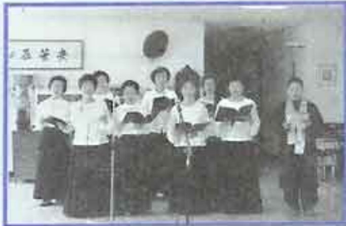
| 찬불가 배우기 |

매달 4째주 토요일엔 찬불가 배우기 시간이 있습니다. 찬불가는 합창단 단원들이 나와서 노래도 가르쳐 드리고 즐겁게 불러 주시기도 하고 있습니다. 다른 노래 부르는 시간보다 찬불가 시간을 어른들이 더욱 좋아 하신답니다.