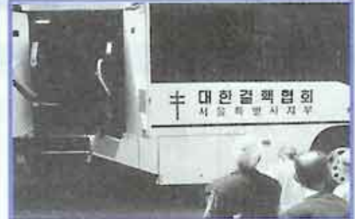
| 결핵검진 |

5월 앞마당에 예쁜 베고니아와 분꽃을 심었습니다. 호미질을 하면서 어른들의 얼굴에 화색이 들었습니다. 우리 어른들 그 어느때 보다도 흙을 만지는 모습이 잘 어울립니다.