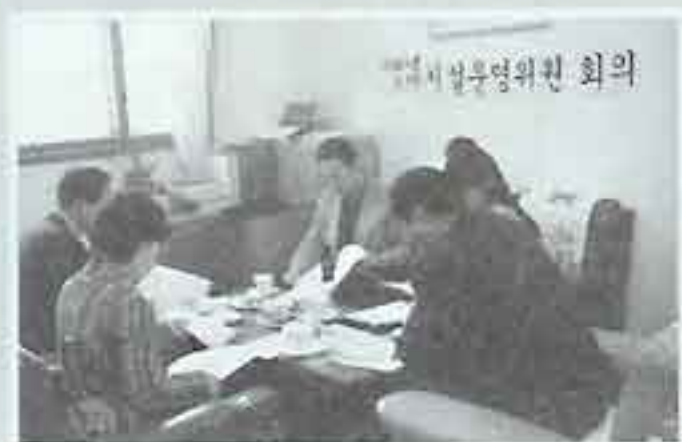
| 시설운영위원회 회의 |

5월3일 대한결핵협회에서 결핵검진이 있었습니다. 해마다 봄이면 받는 결핵검진은 단체생활을 하는 우리어른들에게 꼭 필요한 검진입니다. 우리어른들 모두 건강하세요.