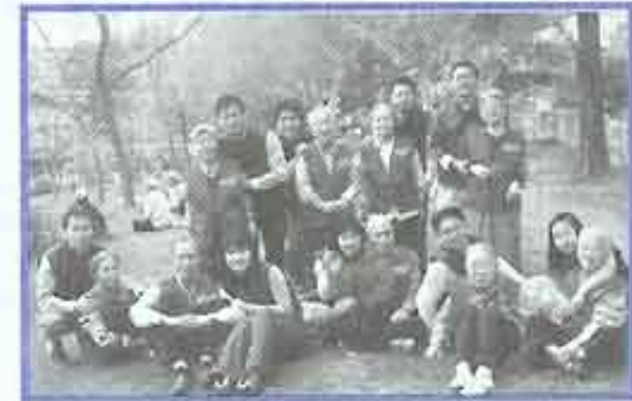
| 공원산책 |

로또재단에서 후원하여 시립양로원 어른 90여명과 우리양로원 45명의 어른들이 함께 청주 스타텔과 이천도자기 박물관에 다녀왔습니다. 청주에서 점심, 이천에서 저녁식사를 하고 돌아온 일정은 함께하는 간만의 외출로 시종 즐거운 시간이었습니다