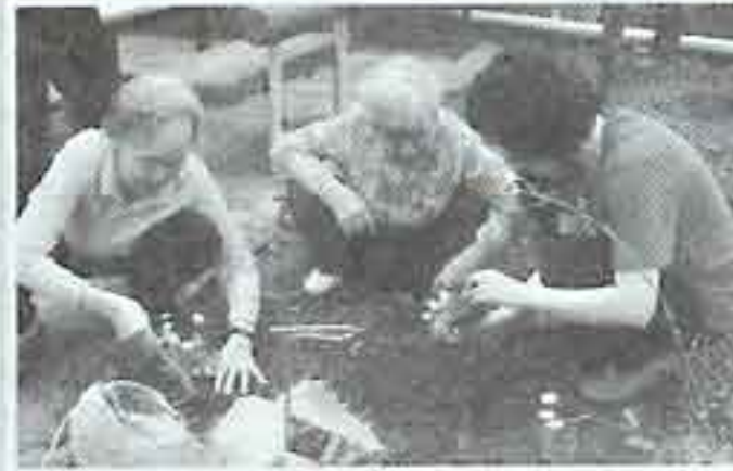
| 원예작동 |

매달 4째주 토요일엔 찬불가 배우기 시간이 있습니다. 찬불가는 합창단 단원들이 나와서 노래도 가르쳐 드리고 즐겁게 불러 주시기도 하고 있습니다. 다른 노래 부르는 시간보다 찬불가 시간을 어른들이 더욱 좋아 하신답니다.