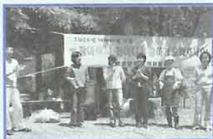
| 어버이날 행사 |

5월18일 서울대학교 치과대학에서 어르신 구강검진을 나왔습니다. 잇몸질환과 의치관리에 대한 얘기를 듣고 검진도 받는 유익한 시간이었습니다.