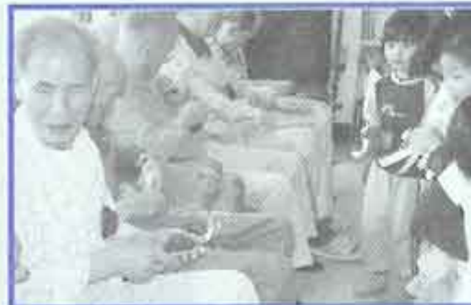
| 카네이션 달기 |

4월27일 시설운영위원회 회의가 있었습니다. 작년결산과 올해의 사업계획에 관해서 얘기를 나누는 시간과 원운영 전반에 걸친 대화로 이루어진 시간은 우리양로원을 다시 한번 조명해 보는 뜻 깊은 시간이었습니다.