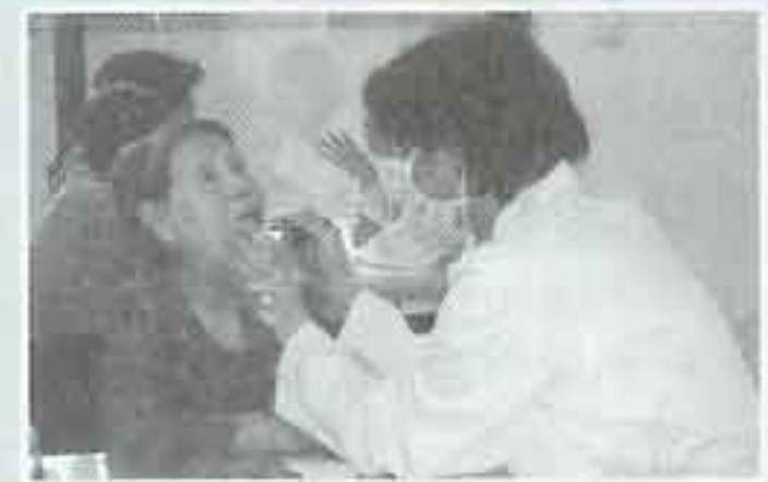
| 구강검진 |

어버이날 아침 혜명보육원 아이들이 카네이션을 들고 양로원을 방문했습니다. 해마다 잊지 않고 어른을 공경하는 마음으로 어버이날 아침이면 양로원을 찾아 오는 보육원 아이들. 늘 카네이션을 전달하는 마음으로 모든 생활을 성실히 하여 나라의 일꾼으로 성장하기를 바래봅니다.