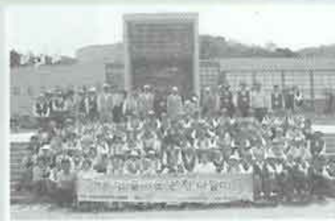
| 온천나들이 |

5월 8일 양로원 정원에서 어버이날 행사가 있었습니다. 자칫 더 외로워지기 쉬운 어버이날 직원모두가 자식이 되어 맛있는 음식도 장만해 드리고 즐거운 여흥시간도 보내드렸습니다.