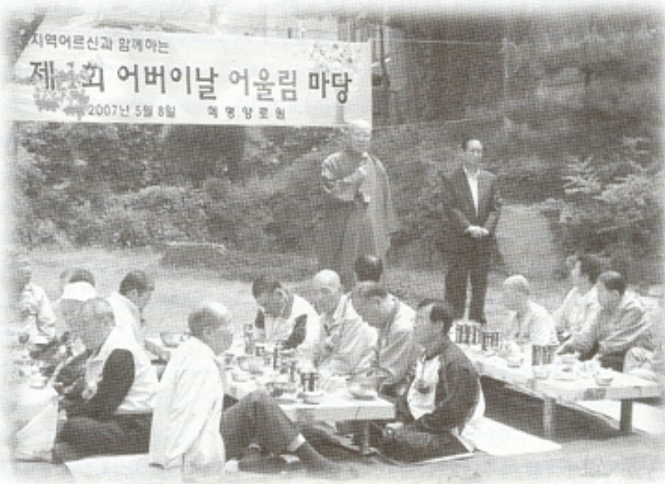
2007년 5월 8일 어버이날 행사