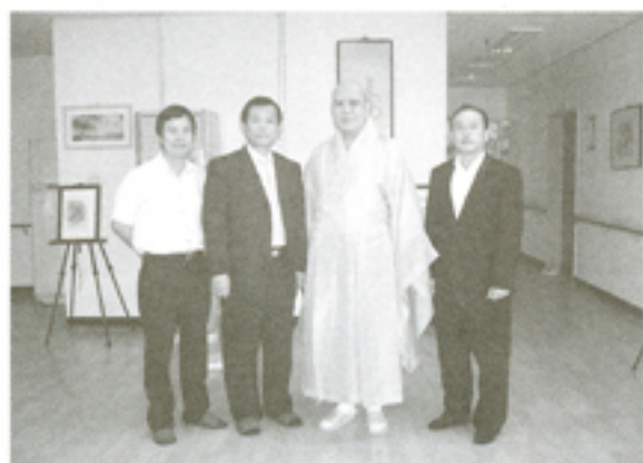
7월 31일 하기수 안양2도소소장님 방문