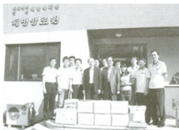
9월 10일 기쁨은향남부이점 추석년분방문