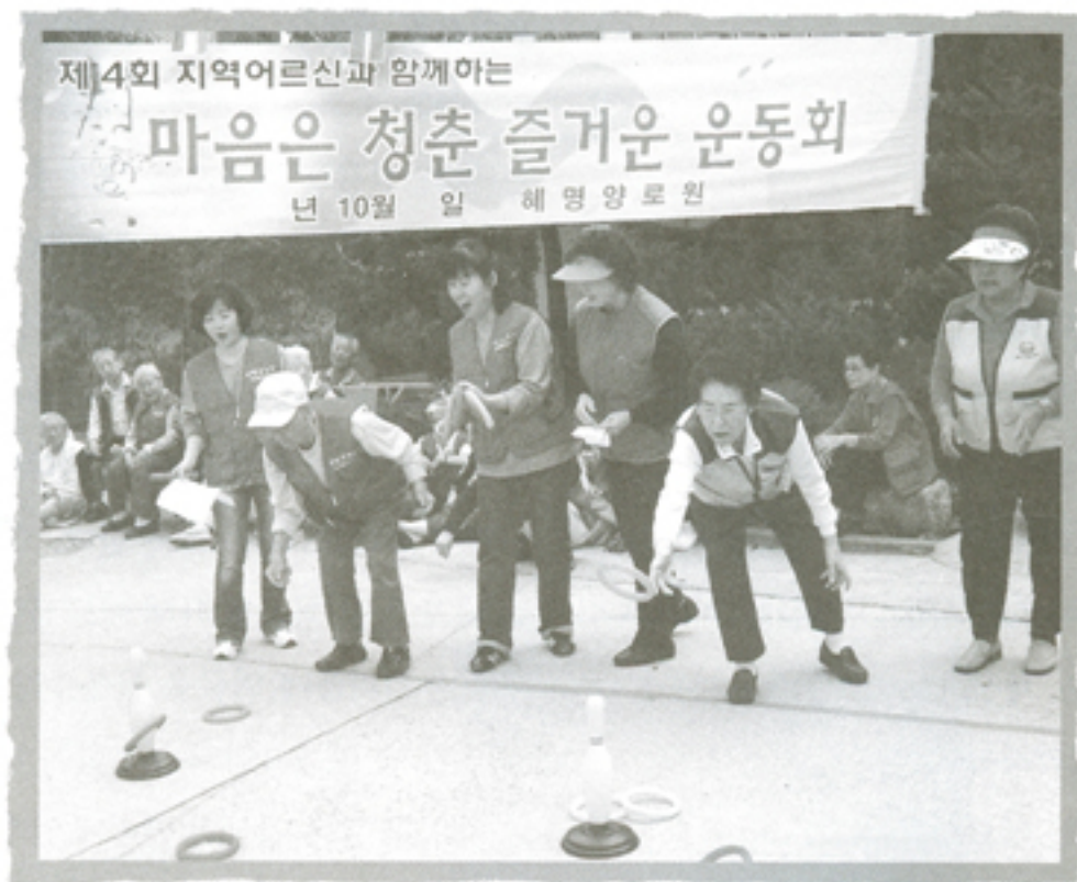
노인의 날 기념 운동회